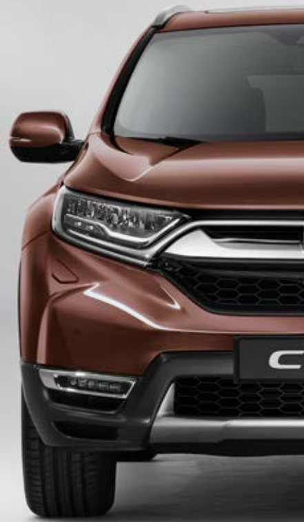
PREMIUM AGATE BROWN PEARL