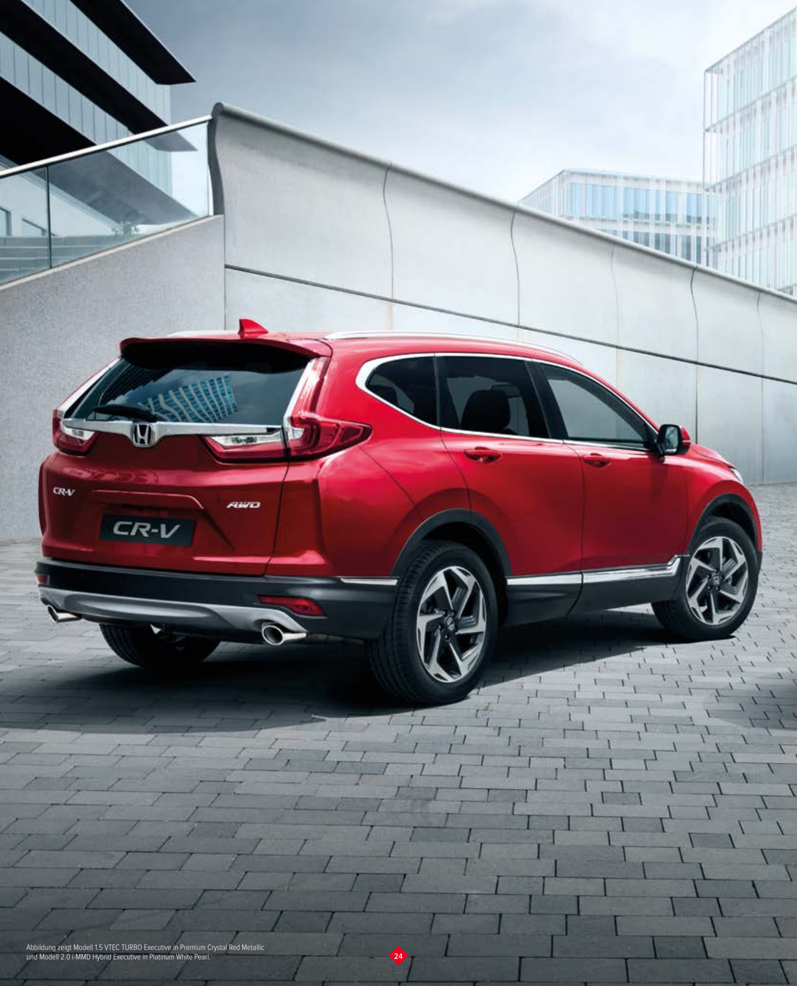
Abbildung zeigt Modell 1.5 VTEC TURBO Executive in Premium Crystal Red Metallic und Modell 2.0 i-MMD Hybrid Executive in Platinum White Pearl.