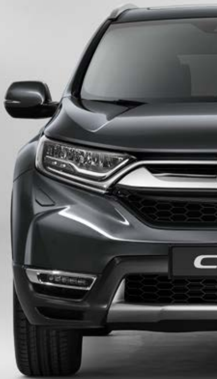
MODERN STEEL METALLIC