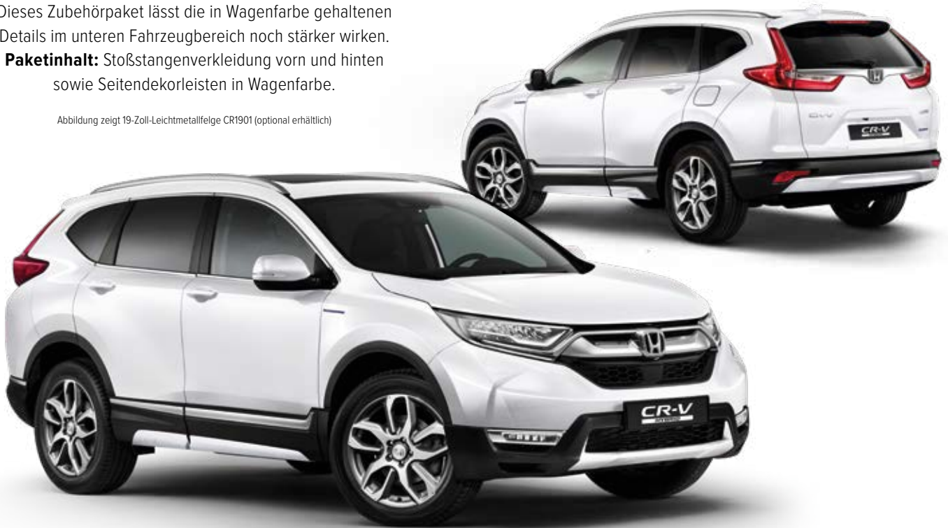
Abbildung zeigt 19-Zoll-Leichtmetallfelge CR1901 (optional erhältlich)

Paketinhalt: Stoßstangenverkleidung vorn und hinten sowie Seitendekorleisten in Wagenfarbe.