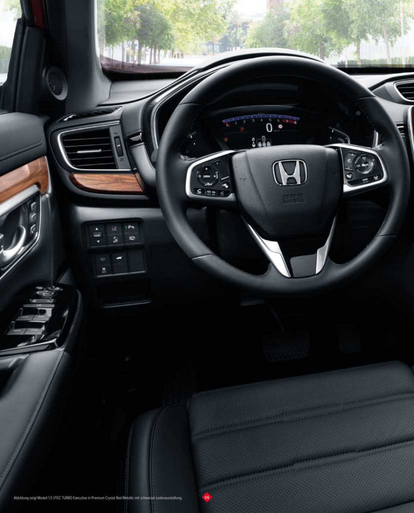
Abbildung zeigt Modell 1.5 VTEC TURBO Executive in Premium Crystal Red Metallic mit schwarzer Lederausstattung.