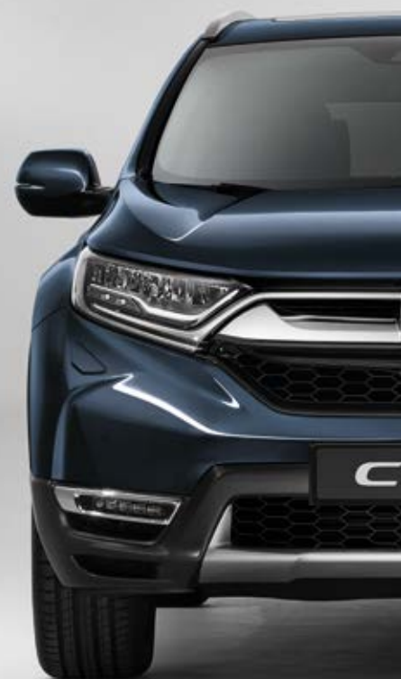
COSMIC BLUE METALLIC