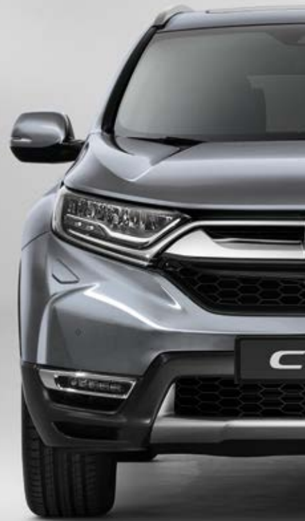
LUNAR SILVER METALLIC