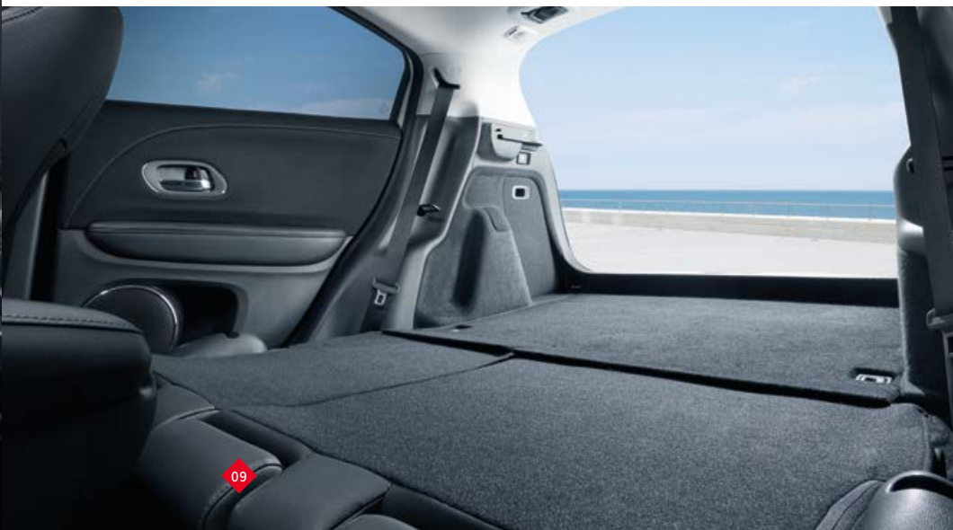
Abbildung zeigt Modell 1.5 i-VTEC Executive. Detaillierte Informationen zum Ausstattungsumfang entnehmen Sie bitte der Tabelle ab Seite 37.

Aber nicht nur die Sitze sind magisch. Die Tatsache, dass der HR-V die gleiche komfortable Bein- und Kopffreiheit bietet, die man von größeren Autos gewohnt ist, kommt ebenfalls einem Zaubertrick gleich. Das großzügige Raumgefühl wird zusätzlich durch ein Panorama-Glasschiebedach betont, das geöffnet werden kann, um Licht und frische Luft hineinzulassen.