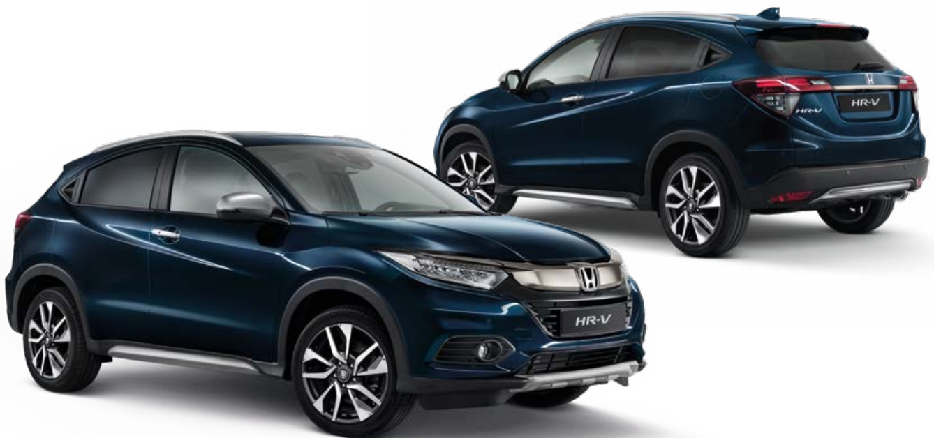
Abbildung zeigt 18-Zoll-Leichtmetallfelge "Stygean"

Paketinhalt: schwarzer Unterfahrschutz vorn und hinten, Trittbretter mit schwarzer Pulverbeschichtung, Black-Edition-Fußmatten und -Kofferraummatte, Black-Edition-Emblem, schwarze Spiegelkappen.