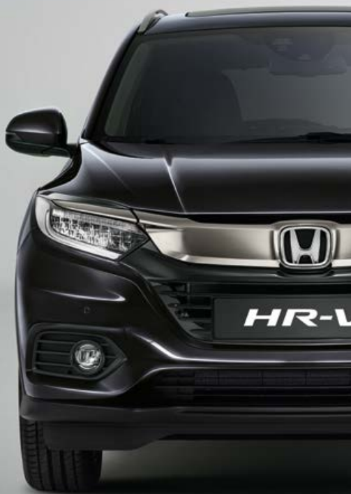
RUSE BLACK METALLIC